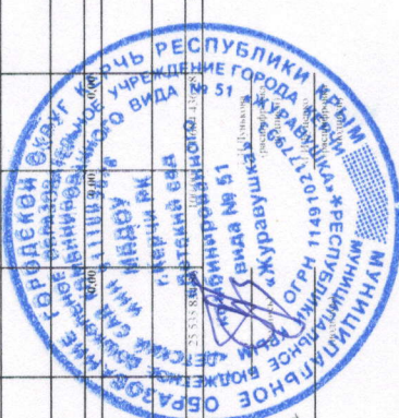
Рис. 2. Сведения о выплатах учреждения Итого 10 321,11